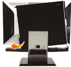
2 Slide the computer onto the stand

將顯示器連接到支架上 將顯示器接上支架 モニターをスタンドに取り付けます モニタ를 스탠드에 부착합니다 ต่อจอภาพกับขาตั้ง