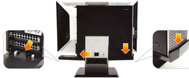
3 Engage the computer to the stand auto locking mechanism

推動計算機，使其滑行至支架上 將電腦推至支架上 コンピュータをスタンドにスライドさせます 컴퓨터를 스탠드에 밀어 넣습니다 เลื่อนคอมพิวเตอร์ เข้าล็อกกับขาตั้ง